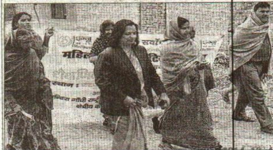
गांव में लोगों को जानकारी देती इग्नू की टीम।