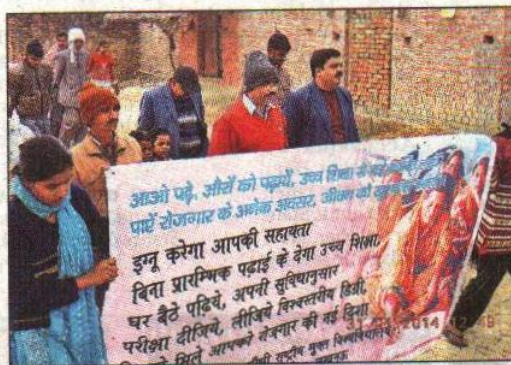
■ IGNOU volunteers holding an educational camp at Natpurwa village in Hardoi on Friday.